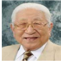
株式会社堀場製作所最高顧問 堀場雅夫

彼女は入社したときから誰よりも明るく元気。率先して全体朝礼で社歌の指揮を務め、社員に元気を与える存在です。彼女のように何事にも積極的で人に元気を与える若者の力が今の京都には必要です。是非、彼女の市政挑戦を応援してください！